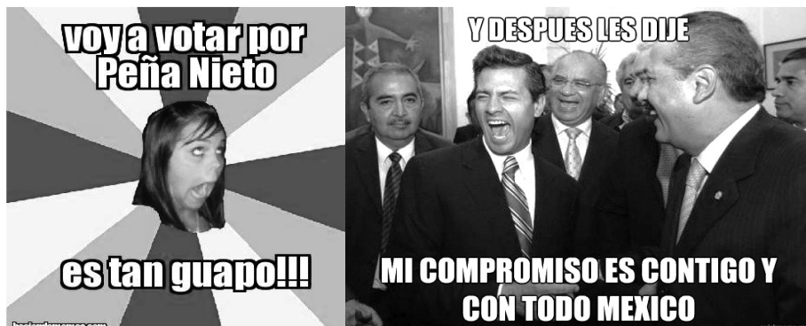
Imágenes 3 y 4

El atractivo del meme político radica no sólo en su rápida distribución y el prácticamente nulo costo del mismo, sino al alcance que, potencializado con el acceso de gran parte de la población mexicana a un gadget con conexión a redes sociales como puede ser un teléfono inteligente, computadora, laptop, tablet o incluso las smart tv, han logrado que éste sea más popular que un chiste político y que uno de cada tres mexicanos haya visto un meme de contenido político en las últimas horas. 4